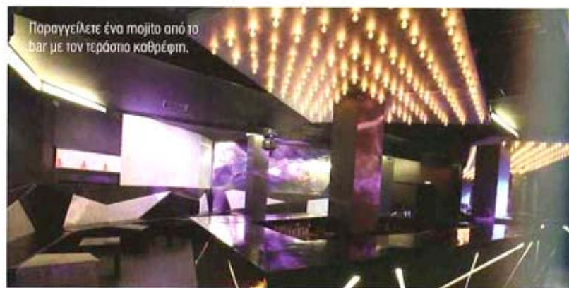
Παραγγείλετε ένα mojito από το bar με τον τεράστιο καθρέφτη.