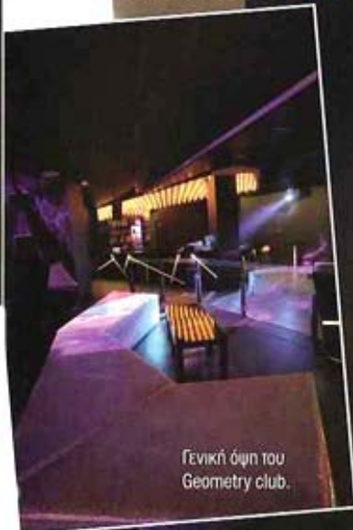
Γενική όψη του Geometry club.