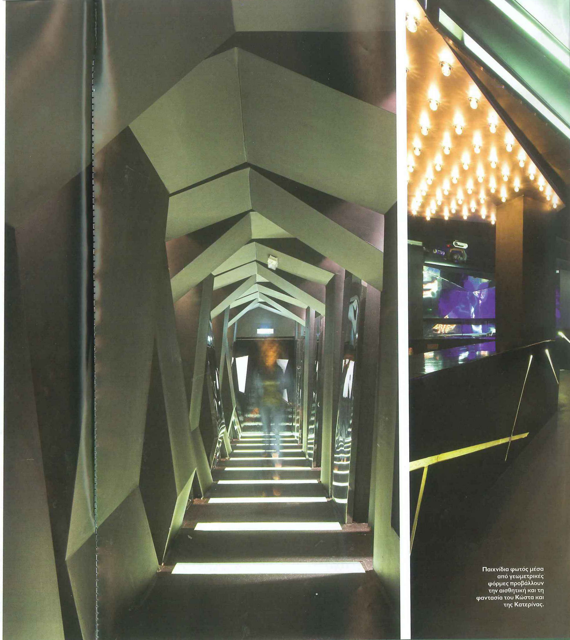
Παιχνίδια φωτός μέσα από γεωμετρικές φόρμες προβάλλουν την αισθητική και τη φαντασία του Κώστα και της Κατερίνας.

Το Fluid architecture ξεκίνησε ως μια ομάδα - πλατφόρμα με σκοπό να φέρει μαζί και σε συνεργασία άτομα και κλάδους που έχουν κοινές αναζητήσεις και προβληματισμούς, και προέρχονται είτε από τον χώρο της αρχιτεκτονικής, της αρχιτεκτονικής τοπίου, του design, της διακόσμησης και γενικά των τεχνών. Η ομάδα λειτουργεί ως μέσο ανταλλαγής ιδεών, σκέψεων και προβληματισμών με σκοπό την κατανόηση του σύγχρονου τρόπου ζωής σε τοπικό και διεθνές επίπεδο, δίνοντας λύσεις μέσα από projects που καλύπτουν ένα ευρύ φάσμα κλίμακας από ένα μικρό κομμάτι επίπλου μέχρι ένα μεγάλο αστικό κτίριο ή ακόμα ένα πολεοδομικό σχέδιο. Το όνομα, εκτός από την έκφραση της φιλοσοφίας →